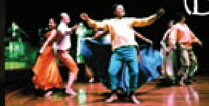
Ingá y Landó (Perú)