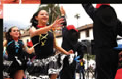
Sayas y Caporales (Bolivia)